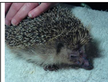
Fipette deux jours après son intervention.