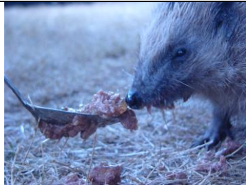
Ripley une semaine après la pose de sa broche

Ripley est arrivée au mois de mai avec une patte complètement disloquée, le vétérinaire a posé une broche, Ripley contrairement aux autres hérissons soignés au sanctuaire a été immédiatement apprivoisée, elle sera désormais notre nouvelle petite mascotte