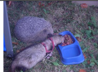
Ripley avec sa grande amie, notre petite furette

Mildred arrivée est arrivée au sanctuaire victime de morsures de chien le 1 er octobre, malgré état général fortement dégradé, les blessures ont bien guéri, nous sommes impatients de la relâcher au printemps