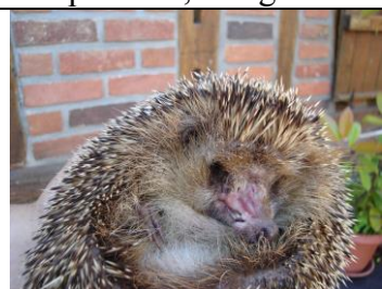
Fipette après un mois de soins intensifs

Fipette a eu une partie du museau emporté par une débroussailleuse, le vétérinaire a tenté l'impossible, une greffe de peau sur le museau