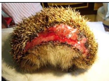
George après 3 semaines de soins, l'espace se rétrécit !