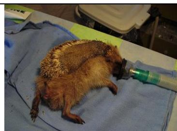
George à son arrivée, brûlé à 30%

George est arrivé avec la moitié du corps brûlé et une patte très abîmée, il a été amputé du pied, après deux mois de soins intensifs il a pu être réinséré au mois d'août dans un jardin d'accueil.