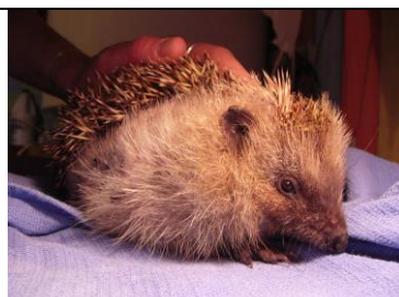
George 2 mois et demi après, avec des piquants en moins mais en pleine forme

Fipette a eu une partie du museau emporté par une débroussailleuse, le vétérinaire a tenté l'impossible, une greffe de peau sur le museau